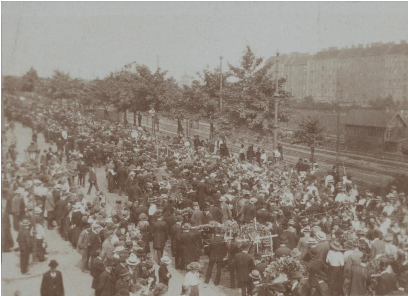
Trauerzug am Bahnhof Lichtenberg

Der Leichnam der am 15.1.1919 ermordeten Rosa Luxemburg wurde erst am 31.5.1919 im Landwehrkanal gefunden. Der Begräbniszug am 9.6.1919 zum Zentralfriedhof Friedrichsfelde führte durch Lichtenberg.