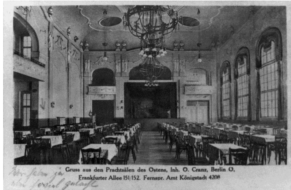
Gruss aus den Prachtsälen des Ostens, Inh. O. Cranz, Berlin O, Frankfurter Allee 151/152. Fernspr. Amt Königstadt 4208

Prachtsäle des Ostens