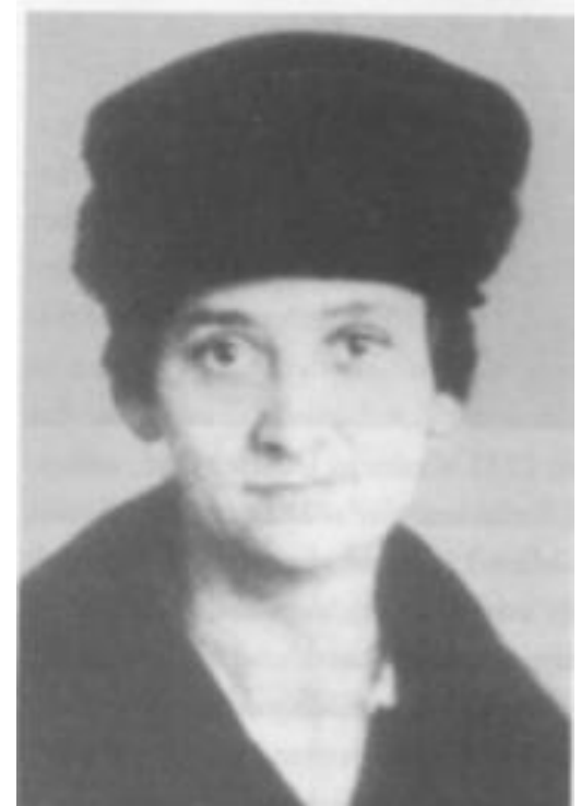
aus: Deutsche Kommunisten. Biografisches Handbuch. 1918 bis 1945, Berlin 2008, S. 72

1915 nahm sie an der Antikriegskonferenz der Sozialistischen Fraueninternationale in Bern teil. Sie schmuggelte die Friedensresolution in ihren Schuhen nach Berlin, ließ sie hundertausendfach drucken und über die Frauenvertreterinnen in ganz Deutschland verteilen.