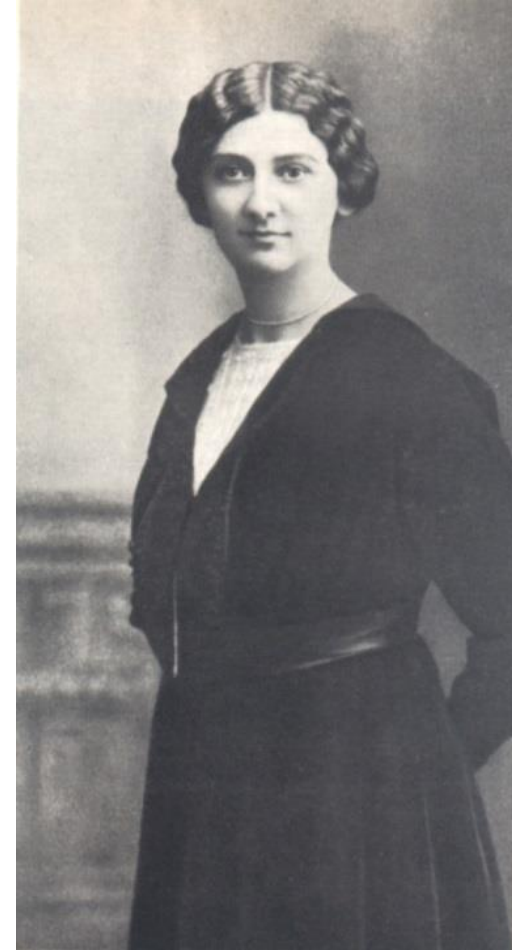
Martha Arendsee

Martha Arendsee berichtete überall über die Anti-Kriegs-Konferenz, auch auf einer Versammlung in der Frankfurter Allee in Lichtenberg.