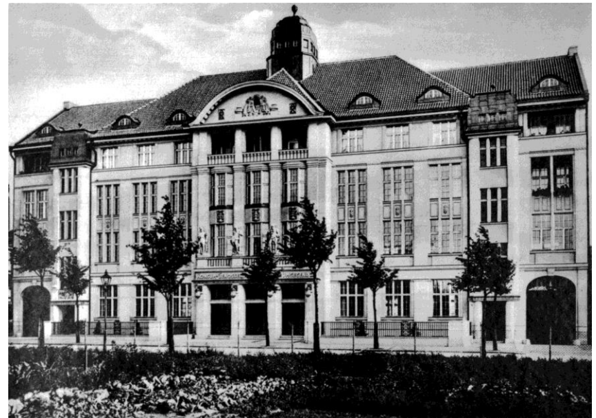
Zentrale der Konsumgenossenschaft Groß-Berlin in Lichtenberg

Aus: Erinnerungen von Martha Arendsee, Bundesarchiv SGY 30 23