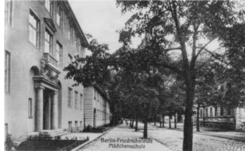
Mädchenschule I in der Wilhelmstraße 73, Adresse der Diakonissen-Station II und der Kleinkinderschule des Vaterländischen Frauenvereins, Foto: Archiv Museum Lichtenberg