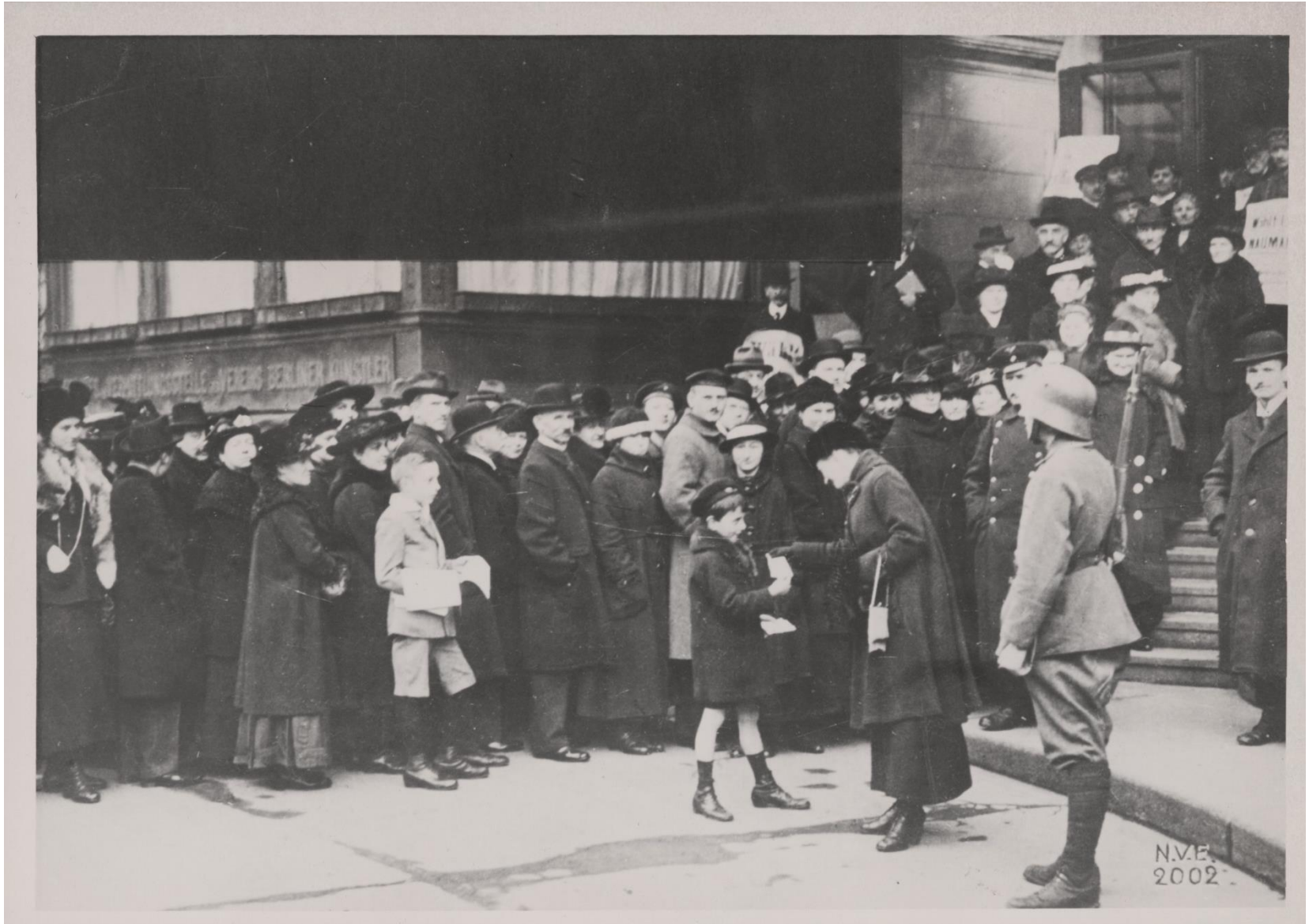
Wahllokal in Berlin