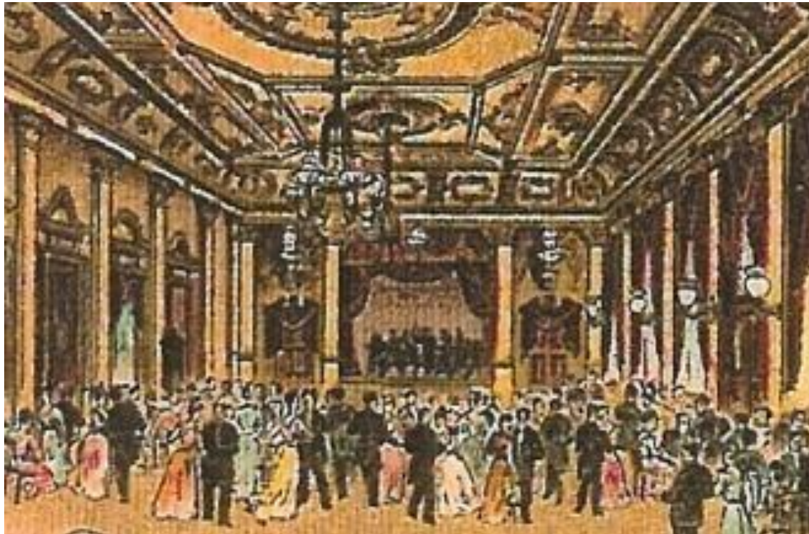
Schwarzer Adler, Versammlungsort der Arbeiterinnenbewegung, Postkartenausschnitt