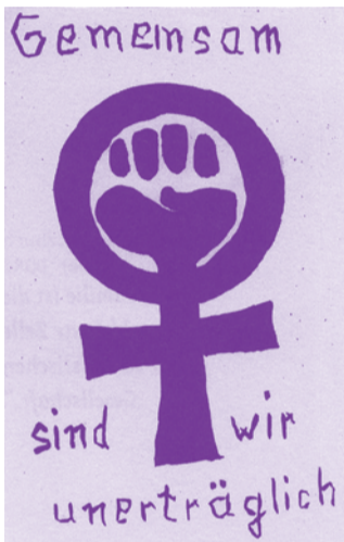
Postkarte Berliner Lesben auf der Friedenswerkstatt 1983.

Romantisches Verlangen und erotisches Begehren zu gleichgeschlechtlichen Partnern sowie gleichgeschlechtliche sexuelle Handlungen sind unterschiedliche Facetten von Homosexualität. Etwa fünf bis zehn Prozent der Bevölkerung sind homosexuell. Aufgrund der sehr konservativen Moralvorstellungen in den 1950er und 1960er Jahren war das Leben für Homosexuelle auch in der DDR zunächst schwer. Obwohl einige verschärfte Paragraphen aus der Zeit der nationalsozialistischen Diktatur abgeschafft waren, blieb Homosexualität grundsätzlich strafbar. Entschädigungen für die Verfolgung durch das NS-System verweigerte der Berliner Magistrat, zumal sich ohnehin nur Wenige trauten, sich offen zu ihrer Homosexualität zu bekennen. Der Strafrechtsparagraf gegen homosexuelle Handlungen wurde in der DDR ab 1957 wegen Geringfügigkeit nicht mehr angewandt und richtete sich ab 1968 nur noch gegen Homosexuelle, die sich an Minderjährigen vergingen. 1988 strich man diesen Paragraphen, weil der Schutz von Minderjährigen allgemein geregelt wurde. 1987 urteilte das oberste Gericht der DDR: »Homosexuelle Menschen stehen somit nicht außerhalb der sozialistischen Gesellschaft, und die Bürgerrechte sind ihnen wie allen anderen Bürgern gewährleistet.« Dennoch hielten sich in der Gesellschaft mangels offenen Diskussionen zahlreiche Vorurteile.