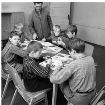
Im Hintergrund der Inoffizielle MfS-Mitarbeiter »Stralau«. Zwischen 1964 und 1971 baute er ein Netz inoffizieller Mitarbeiter aus Erziehern und zur Mitarbeit erpressten Jugendlichen und Kindern auf. Wegen zahlreicher Unterschlagungen und sexueller Übergriffe auf die Insassinnen wurde er 1971 aus »gesundheitlichen Gründen« aus dem Heim abgezogen, blieb aber weiterhin für das MfS als hauptamtlicher Mitarbeiter tätig.