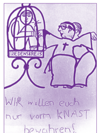
Abbildung rechts: Mit dieser Karikatur machte der Friedenskreis Friedrichsfelde auf die zwiespältige Rolle der Kirche gegenüber den Friedens- und Umweltgruppen aufmerksam.