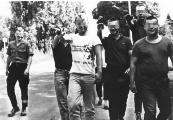
Posierende Rechtsradikale in der DDR-Hauptstadt, Mitte der 1980er Jahre.

Comic Eine Auseinandersetzung mit der zunehmenden Gewalt durch Neonazis in der DDR, Frühjahr 1988. Dirk Moigt