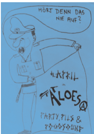
Einladungen und Bilder von Partys und Konzerten im Pro-Fi-Keller.