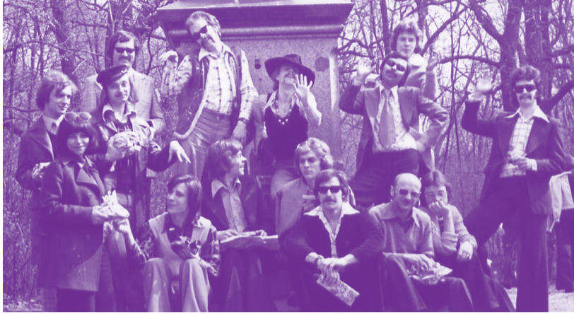
Foto: Gruppenbild der Homosexuellen-Initiative HIB.