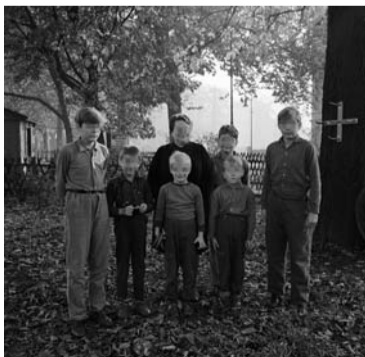
Im Hintergrund die Inoffizielle MfS-Mitarbeiterin »Tolstoi«. Sie gewann aufgrund ihres einflussreichen Umgangs das Vertrauen von einsitzenden Jugendlichen und warb mehrere von ihnen für das MfS an. Anfang der 1970er Jahre wurde »Tolstoi« Leiterin eines anderen Heims.

Im Gebäude der Thalia-Grundschule in Stralau betrieb die Jugendhilfe der DDR zwischen 1952 und 1989 ein Durchgangsheim. Ursprünglich dienten Durchgangsheime der kurzfristigen Aufnahme von elternlosen, aus dem Elternhaus genommenen, kriminell gefährdeten, entwichenen oder aufgegriffenen Kindern und Jugendlichen. Diese Begriffe nahmen Bezug auf die unmittelbare Nachkriegssituation, in der elternlose Kinder und Jugendliche aus Überlebensgründen kriminell geworden waren. Bedeutung und Aufgabenstellung der Durchgangseinrichtungen in der DDR blieben von 1948 bis 1989 relativ unbestimmt. Es gab viele Verordnungen und Anweisungen neben einigen Entwürfen, die ihrem Inhalt nach widersprüchlich waren. 1952 wurde festgelegt, dass straffällige Jugendliche während eines Strafverfahrens von Organen der Jugendhilfe begleitet werden sollten. Danach hatten Freiheitsstrafen in den Häusern der Jugendhilfe zu erfolgen, womit Einrichtungen wie Jugendwerkhöfe und auch das Durchgangsheim Alt-Stralau gemeint waren.