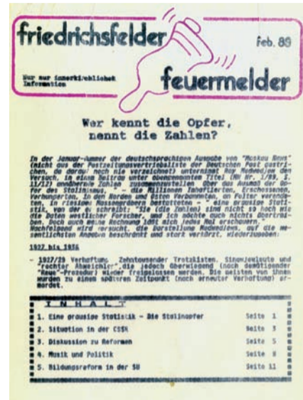
Der Friedrichsfelder Feuermelder war die seit 1987 monatlich herausgegebene Zeitschrift des Friedrichsfelder Friedenskreises.

Einige Mitarbeiter des Friedenskreises engagierten sich zeitweilig in der Politik, andere gründeten Vereine und Bürgerkomitees zur Aufarbeitung der DDR-Geschichte.