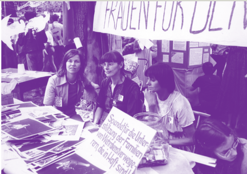
Foto: Am Stand der »Frauen für den Frieden« auf der Friedenswerkstatt 1986.