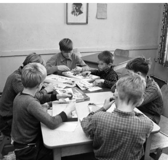
Kinder beim Spielen im Aufenthaltsraum des Durchgangsheims. Dieses »offizielle« Foto verschweigt, dass die Kinder für mehrere Industriebetriebe arbeiten mussten und ihnen kaum Schulunterricht erteilt wurde.