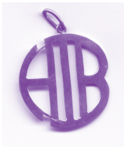
HIB-Anhänger Zeichen der Homosexuellen-Initiative. Das MFS bemerkte Ähnlichkeiten zum Hakenkreuz.