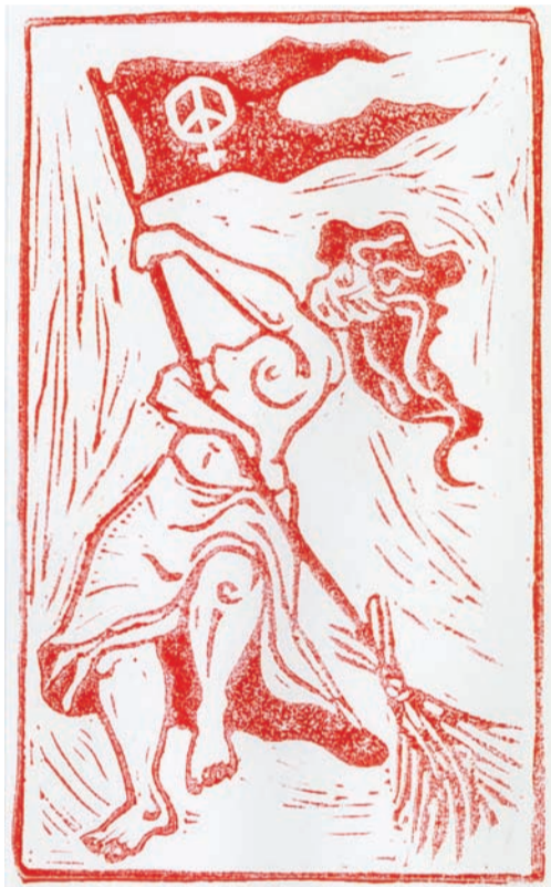
»Die Hexe sollte helfen, den DDR-Stall auszumisten!« Holzschnitt 1984, Gudrun Birk-Gierke.