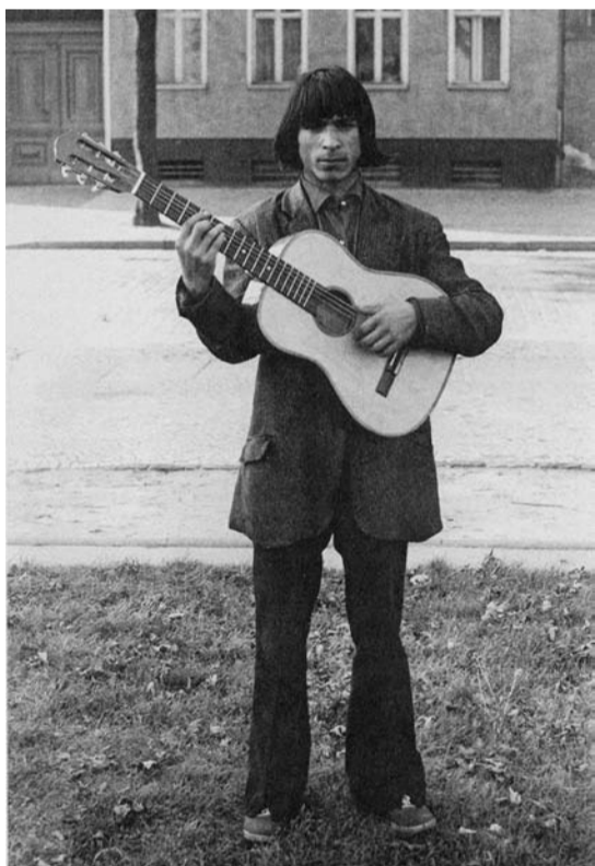
Nunnu, September 1967 Dieses Foto, eine Art Gegenbild zum FDJler, fand seinerzeit bei aufmüpfigen DDR-Jugendlichen Anklang.

Im Gegensatz zum nachlässigen Umgang mit Roma, wenn es um deren Interessen ging, zeigten die Behörden besonderes Engagement, wenn der Verdacht der Vernachlässigung von Kindern in der Luft lag. Es kam vor, dass Kinder und Jugendliche aus Sinti- und Romafamilien in Kinderheime eingewiesen wurden. In Lichtenberg ist so ein Fall aus den 1980er Jahren bekannt. Ein Sinto, der von seinen Mitschülern gehänselt und angegriffen wurde und sich zur Wehr setzte, wurde von der staatlichen Jugendhilfe in ein weit entfernt liegendes Kinderheim gebracht, wo der Junge völlig isoliert war. Ihm wurde unter anderem verboten, mit seinen Eltern in ihrer Sprache zu telefonieren. Erst nach mehrfachen Interventionen eines Freundes an höchste Parteistellen gelang es nach Monaten, den Jungen wieder zurück zu seinen Eltern zu bringen. Den meisten DDR-Bürgern war nicht bewusst, welchen Diskriminierungen Sinti und Roma ausgesetzt waren. Dagegen genoss die Band »Sinti-Swing«, ein Zusammenschluss aus musizierenden Familienangehörigen, durchaus Popularität. Regelmäßig trat »Sinti-Swing« in den 1980er Jahren im Klub NAPF in der Pfarrstraße 139 auf. 1986 konnte die Band sogar eine Schallplatte herausbringen.