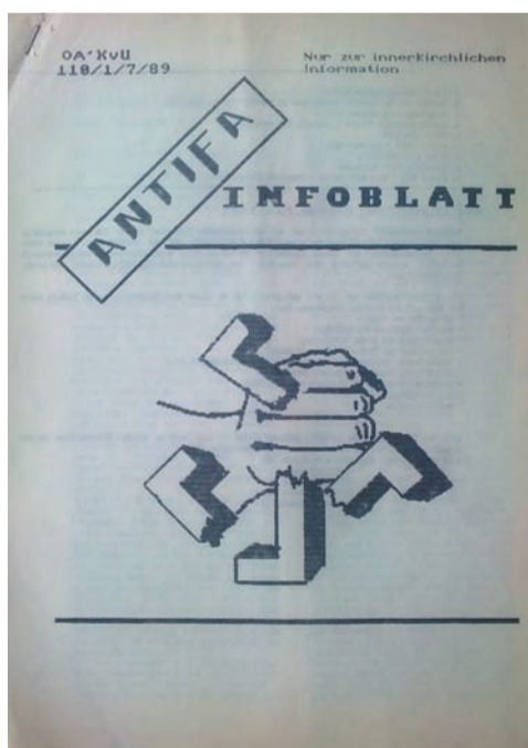
Durfte in der DDR nur illegal erscheinen: Antifa-Infoblatt der Antifa in der Kirche von Unten, Juli 1989.

1988 wurde im Pro-Fi-Haus eine begleitende Jugendarbeit mit rechtsradikalen Jugendlichen begonnen, die bis in die 1990er Jahre lief. Dabei wurde in Gesprächen, in Arbeitssituationen und auf Freizeitreisen versucht, konkret auf Vorstellungen, Ängste und Verhaltensweisen der Jugendlichen einzugehen. Weil rechtsradikales Gedankengut und Gewaltreflexe bei diesen Jugendlichen nicht sofort verschwanden, wurde die Arbeit oft kritisiert. Doch zeigte sich mittel- und langfristig, dass diese begleitende Jugendarbeit erfolgreicher war, als die des SED-Staates, der nur mit einem gestaffelten System von Strafen reagierte.