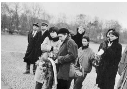
Kranzniederlegung Berliner Lesben in der KZ-Gedenkstätte Ravensbrück. Im Hintergrund zwei Aufpuffer des MFS.

1986 gelang es, mit dem Sonntags-Club eine Initiative zu gründen, die nicht an die Kirche gebunden war. Sie kam im Kreiskulturhaus Mitte unter, nachdem ein SED-Kulturfunktionär den Zugang zum Kreiskulturhaus Prater verweigert hatte. Der Versuch des MFS, diesen Club zu zersetzen, war politisch nicht mehr durchsetzungsfähig. Andere staatliche Organe hatten längst erkannt, dass Gruppen von homosexuellen Aktivistinnen und Aktivisten mit ihren Initiativen zur Aufklärung, zum Beispiel über die Immunkrankheit AIDS, der Gesellschaft einen wertvollen Dienst leisteten. In der Bundesrepublik blieb der Paragraph 175 gegen Homosexuelle bis 1994 gültig, wurde aber kaum und zuletzt gar nicht mehr angewandt.